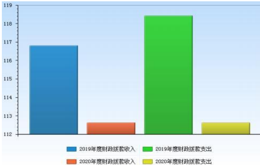
图 1: 2019-2020 年财政拨款收支情况(单位: 万元)